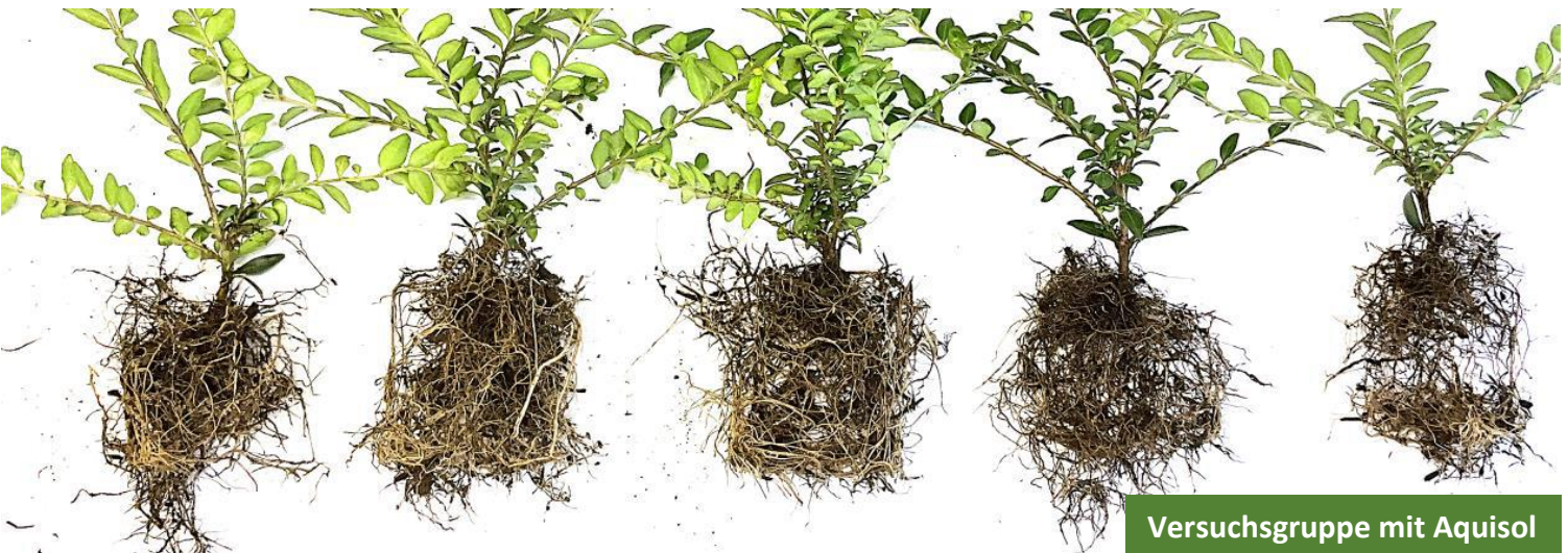
Versuchsgruppe mit Aquisol