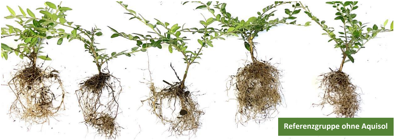
Referenzgruppe ohne Aquisol